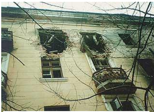
Рис. 5. После взрыва в доме

Печальная статистика жертв террористических актов не обошла и нашу страну. До распада СССР и обострения национальных конфликтов терроризм в нашей стране был весьма редким явлением. Единственный нашумевший случай в 1970-х гг. - это взрыв в вагоне московского метро в январе 1977 года, который унес более десяти жизней. Начиная с начала 1990-х гг. ситуация кардинально изменилась.