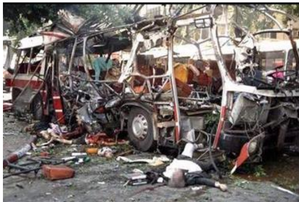
Рис. 3. Взрыв автобуса с людьми в Израиле

- политические похищения, имеющие целью добиться определенных политических условий, освобождения из тюрьмы сообщников и т.д.;