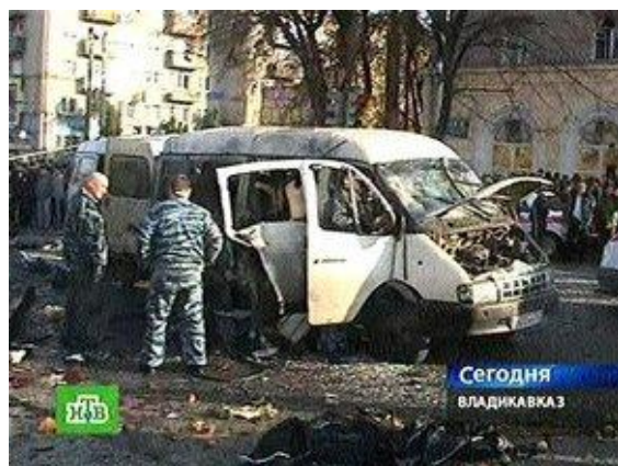
Рис. 7. Взрыв маршрутного автобуса

действие взрывное устройство мощностью до двух килограммов в тротиловом эквиваленте. 10 человек погибли, более 50-и получили ранения.