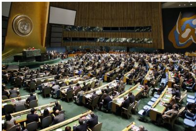
Рис. 9. Страны ООН - против терроризма

Сегодня на первый план выдвигается борьба против международного терроризма, который стал главной угрозой жизни и здоровью людей, а также стабильности мировой экономической и политической систем. Активные шаги в этом направлении проводятся на различных уровнях. На уровне глав государств и правительств, спецслужб, вооруженных сил, политических и общественных организаций и движений.