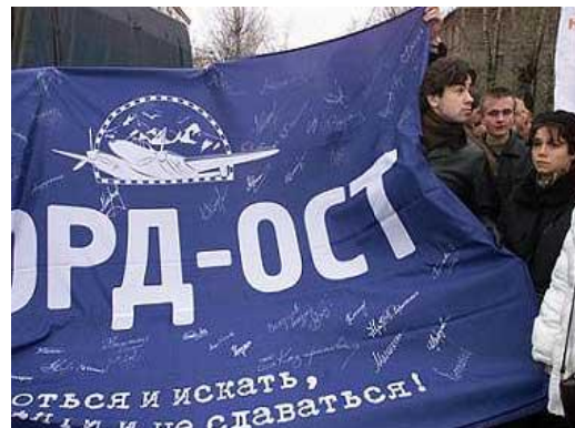
Рис. 6. Люди осуждают террористов

2004, 31 августа рядом со станцией метро «Рижская» террористка-смертница привела в