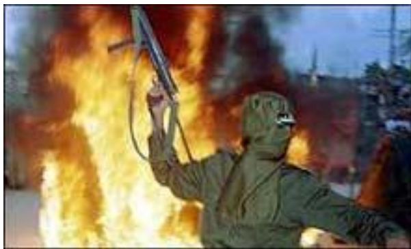
Рис. 4. Современный облик терроризма

Сегодня наблюдается резкий всплеск и качественные преобразования терроризма. Терроризм значительно расширил свою географию, охватил Латинскую Америку и Азию. Он обрел черты наступательности, высокой технической оснащенности, отличается изощренностью и жестокостью.