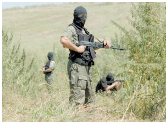
Рис. 11. Специальное подразделение проводит контртеррористическую операцию

На антитеррористические комиссии возлагаются функции координации деятельности территориальных органов исполнительной власти и органов местного самоуправления по профилактике терроризма, а также по минимизации и ликвидации последствий его проявлений. Комиссии возглавляют высшие должностные лица субъектов Российской Федерации.