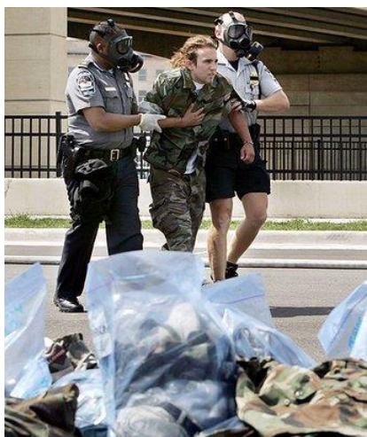
Рис. 13. Оказание помощи после взрыва

Необходимо помнить, что метро (помещения, вагоны) – это замкнутые пространства. Во-первых, здесь затруднены, а порой, невозможны свободные перемещения вследствие давки из-за паники, остановки поезда в тоннеле и т.п. Во-вторых, взрыв в замкнутом пространстве гораздо опаснее, чем на открытом воздухе, так как взрывной волне, образуемой давлением распространяющегося газа, некуда уходить, и она причиняет гораздо больше вреда, чем на открытом пространстве.