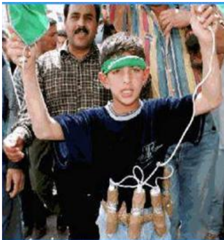
Рис. 8. Он уже готов проститься с жизнью («пушечное мясо» главарей терроризма)

б) людей неквалифицированных в профессиональном плане, но имеющих те или иные причины примкнуть к террористам (идеологические, материально-бытовые, стремление избежать уголовной ответственности за совершенные ранее преступления, отомстить за что-то властям). Эта категория представляет «пушечное мясо», рассчитанное либо на одноразовое использование, либо на непродолжительный срок пребывания в рядах террористов.