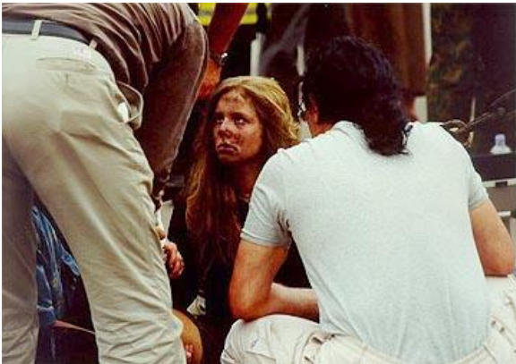
Рис. 2. Сразу после теракта

Отвечая на поставленный вопрос, необходимо подчеркнуть, что терроризм не есть что-то беспричинное или коренящееся в дефектах биологической природы человека. Это - явление, прежде всего, социальное, имеющее корни в условиях социального бытия людей. Именно здесь содержатся истоки потенциальных проблем и