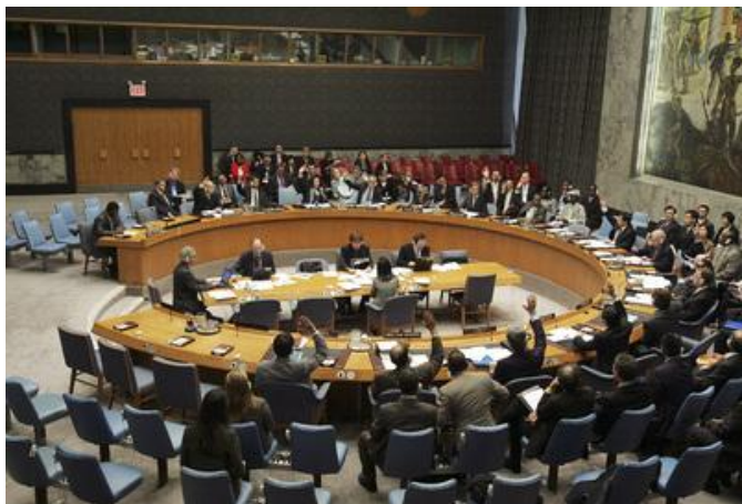
Рис. 10. Совет безопасности обсуждает проблему противодействия терроризму

Департамент по вопросам разоружения (ДВР) занимается созданием и ведением единой базы данных по биологическим инцидентам, которая содержит детальную информа-