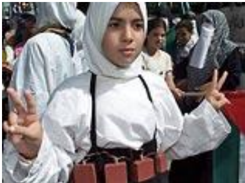
Рис. 12. Она готова стать террористкой

Непосредственную работу с потенциальным шахидом проводят «штатные» психологи террористических организаций.